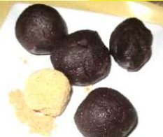
おはぎ作り(EFユニット)