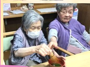
4/1 抹茶を嗜む お花見会