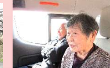
4/5・6 お花見ドライブ